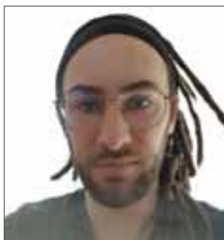
Sandro Eiler