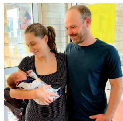
Heute geht's nach Hause, dort freut sich der große Bruder auf den Familienzuwachs.