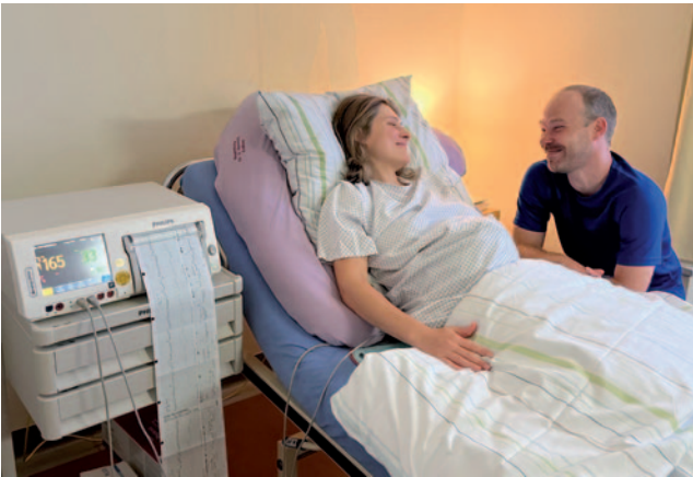
Wird es Mädchen oder ein Junge? Die jungen Eltern wollen sich überraschen lassen...