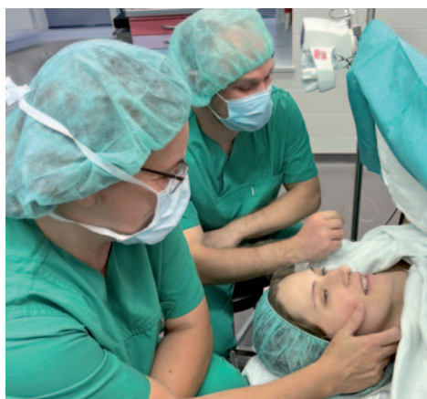
Einfühlsam kümmern sich die Kolleginnen von der Anästhesie um die junge Mutter.