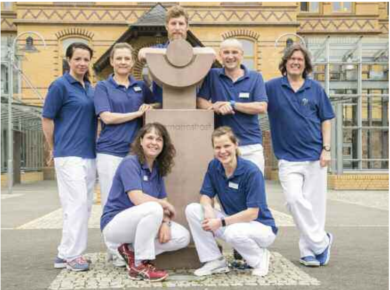
Die Sporttherapeuten des Bergmannstrost.

Alle Sporttherapeuten im Bergmannstrost sind Hochschulabsolventen – Sportlehrer oder Sportwissenschaftler mit einer Spezialisierung im Reha-Behindertensport und etlichen Zusatzqualifikationen. In Kenntnis vorangegangener Diagnosen und Therapien, nach Absprache mit den Ärzten, im engen Miteinander mit Physiotherapeuten und einem ersten Patientengespräch