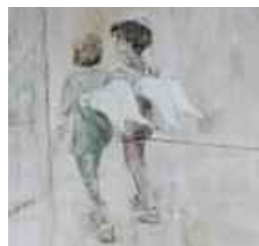
Pappflügler nannte Edith Kramer ihre Kunstwerke mit Menschen, die ganz bei sich sind, in sich ruhen, ganz vertieft in ihr Tun.