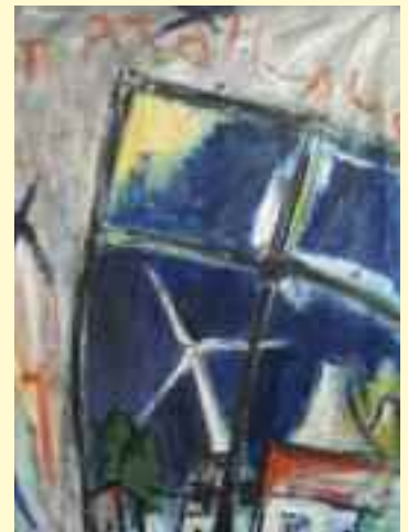
Die Bilder „Bienenweide“ und „Ausblick“ von Brigitte Ganß.