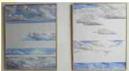
Die Himmelsbilder entstanden in der Kasseler Zeit. In Magdeburg hat sich der Professor der Hochschule Magdeburg anderen Themen zugewandt.