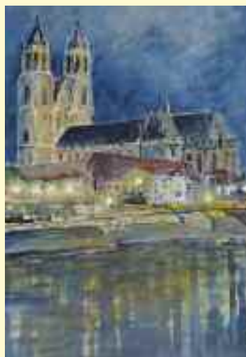
Malerei von Elke Scheffter.

„Bunt ist die Welt“ und „Der blaue Planet“ so die Themen der Ausstellung mit Werken der Magdeburger Malgruppe Heise, die seit 5. November in der Fachambulanz zu sehen ist. Die Künstler zeigen das Schöne der Erde, das unbedingt erhalten werden muss.