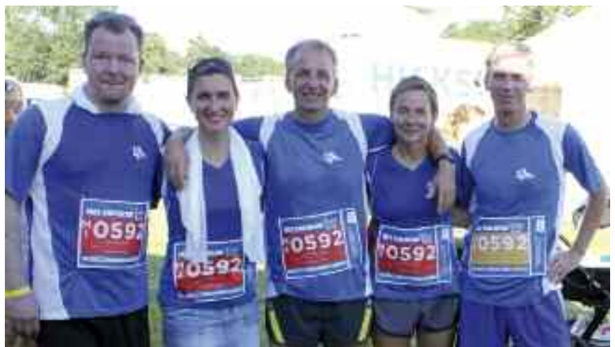
Das Team aus der Klinik für Anästhesie, das in der Mixed-Kategorie einen guten 14. Platz belegen konnte. Insgesamt starteten 500 Mixed-Teams.