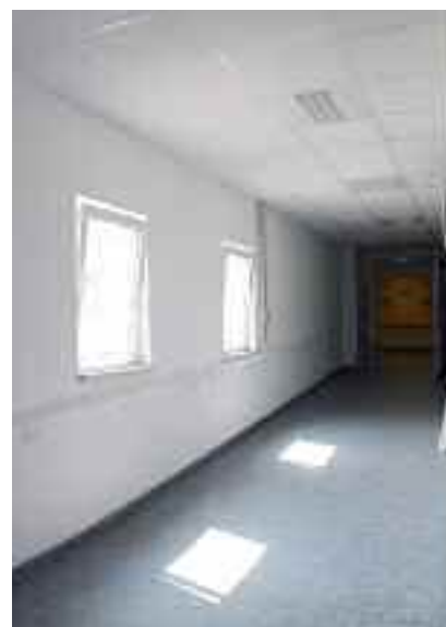
Dieser Interimgang verbindet derzeit das Hauptgebäude mit der onkologischen Bettenstation.

Parallel zu den Arbeiten für Haus D wird gegenwärtig das ursprüngliche Gebäude C saniert, das unlängst durch einen Neubau erweitert worden ist. Nach dem Umzug der psychiatrischen Kliniken war das notwendig geworden.